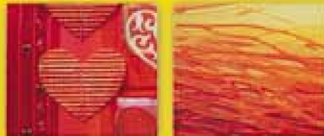
Gesamtansicht siehe letzte Umschlagseite

Tipp Malgele trocknen transparent auf und können schon vor dem Verwenden mit Farbe gemischt werden. Nur beim Strukturgel Hologramm geht durch Einmischen von Farbe der Glitter-Effekt verloren. Daher das Hologramm immer erst zum Schluss über die trockene Farbe streichen.