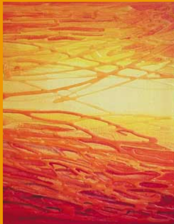
Acrylmalerei mit Fadengel (Anleitung siehe Seite 2)