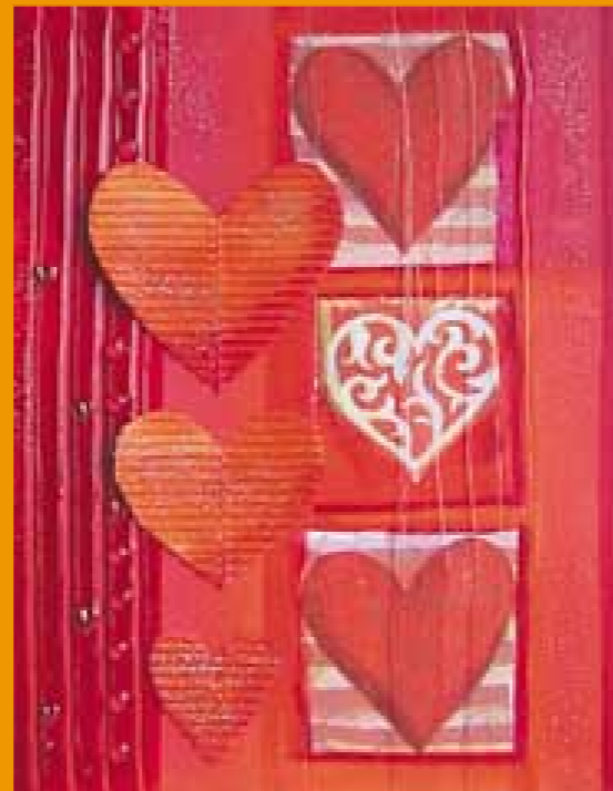
Acrylmalerei mit Impasto Malgel seidenmatt